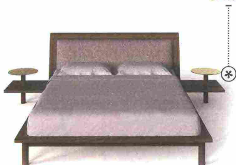
MINIMALE in legno con testata imbottita, Timberg ha comodini in ottone o vetro [Alf DaFrè, prezzo e misure da definire].

OPTIONAL: i ripiani-comodino sono integrabili alla struttura del letto.