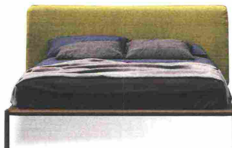
LIGHT e giovane, Rain abbina la maxi-testata in tessuto alla base in legno [Novamobili, cm 198x226x100h € 2.346].

LA TESTATA IMBOTTITA è il supporto perfetto quando si vuole leggere a letto.