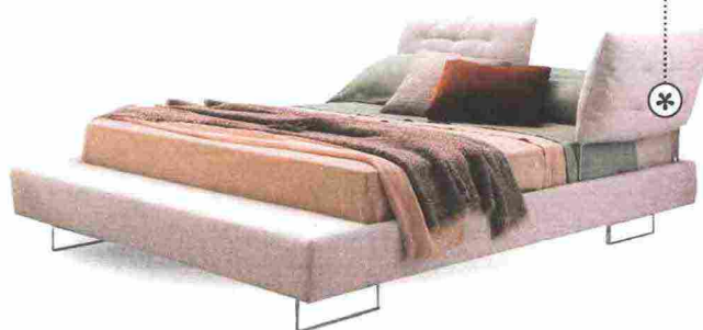
VERSATILE Limes T Large , in tessuto Avant Après, ha i pannelli-testata da posizionare a piacere [Saba Italia, cm 174x240x89h da € 3.590].