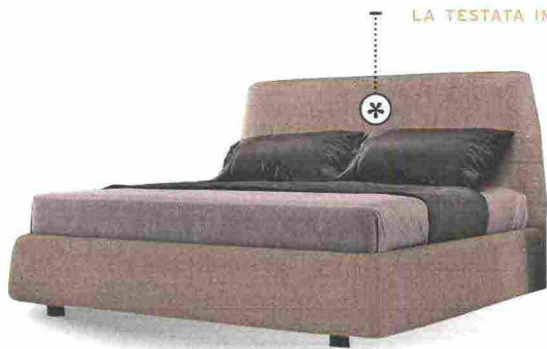
IMBOTTITO e rivestito in morbido tessuto Passirio, Bellini ha testata a trapezio [Febal Casa, cm 190x221x115h € 1.483].

LA TESTATA IMBOTTITA è il supporto perfetto quando si vuole leggere a letto.