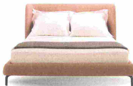
AVVOLGENTE Desdemona ha testiera a conchiglia e rivestimento in tessuto rosa [Ligne Roset, da cm 188x237x77,5h da € 3.534].

LA RETE SI SOLLEVA? Controlla quanto può pesare al massimo il materasso, per non rovinare il meccanismo.