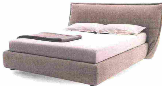
MORBIDO e dalla soffice e accogliente testata, Softly ha un comodo contenitore sotto la rete [Calligaris, cm 220x238x107h da € 1.849].

LETTO, DORMEUSE O MAXIDIVANO? scegli tu in base al momento posizionando le testate dove vuoi.