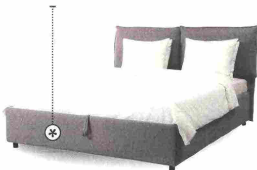
SUPERPRATICO Gressvik è totalmente sfoderabile e ha il box contenitore sottorete [Ikea, cm 175x208x108h € 389].

LA RETE SI SOLLEVA? Controlla quanto può pesare al massimo il materasso, per non rovinare il meccanismo.