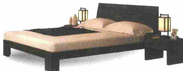
ECOLOGICO perché assemblato a incastro, Aurora è in massello di faggio lamellare [Cinius, cm 166x206x27h da € 646 senza testata].