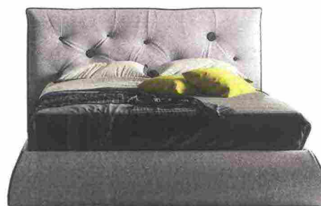
NEO-CLASSICO con testata capitonné, Roger si riveste con tessuto o ecopelle [Giessegi, cm 195x203/213x105h prezzo dal rivenditore].