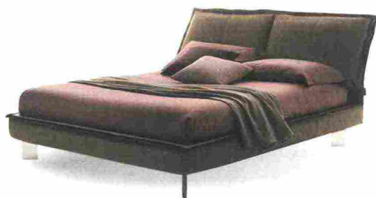
PREZIOSO e vestito in pelle, Sandy H17 può avere il vano SecretBox® [Bontempi Casa Letti Design, cm 201x228x109h prezzo da definire].