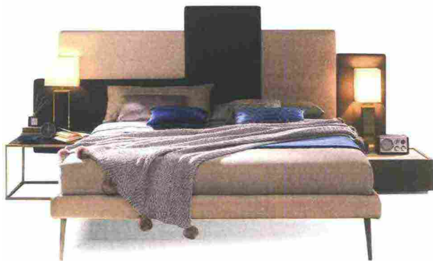
CONTEMPORANEO NC501 ha la testata Tetris componibile a pannelli e il giroletto Slim [Moretti Compact, cm 269x212x150h € 1.172].

Minimali o supermorbidi , decisamente comodi ed eleganti, ecco i modelli che garantiscono notti 100% relax