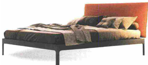
EASY-CHIC Soft ha la testata imbottita rivestita in tessuto Smack S07. Giroletto e gambe ardesia [Désirée, cm 168x209/219x92h € 1.006].

LETTO, DORMEUSE O MAXIDIVANO? scegli tu in base al momento posizionando le testate dove vuoi.